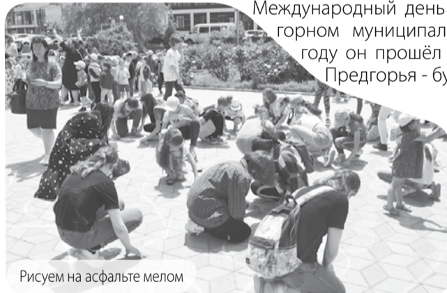
Рисуем на асфальте мелом

Международный день защиты детей. В Предгорном муниципальном округе в этом году он прошёл под девизом «Дети Предгорья - будущее России».