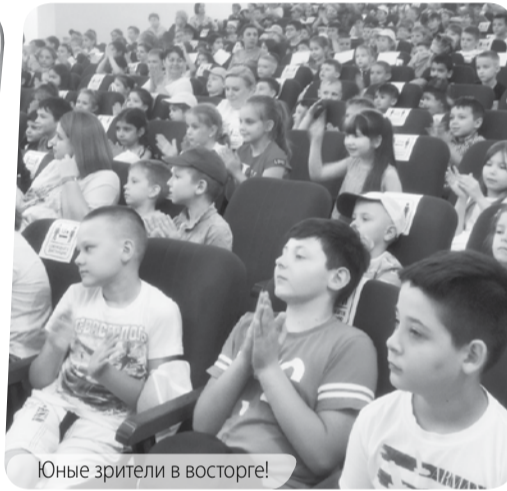
Юные зрители в восторге!