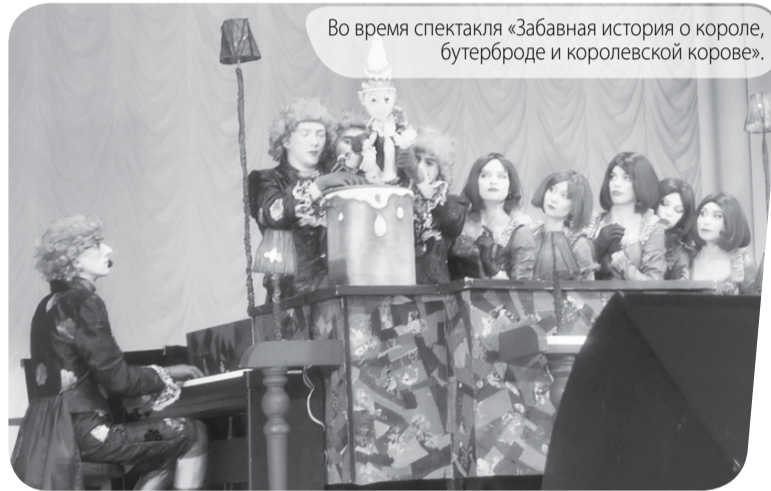
Во время спектакля «Забавная история о короле, бутерброде и королевской корове».