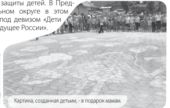
Картина, созданная детьми, - в подарок мамам.