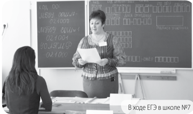
В ходе ЕГЭ в школе №7

Вчера 276 выпускников школ Предгорного муниципального округа сдали первый Единый государственный экзамен. В этом году обязательный ЕГЭ один - это русский язык.