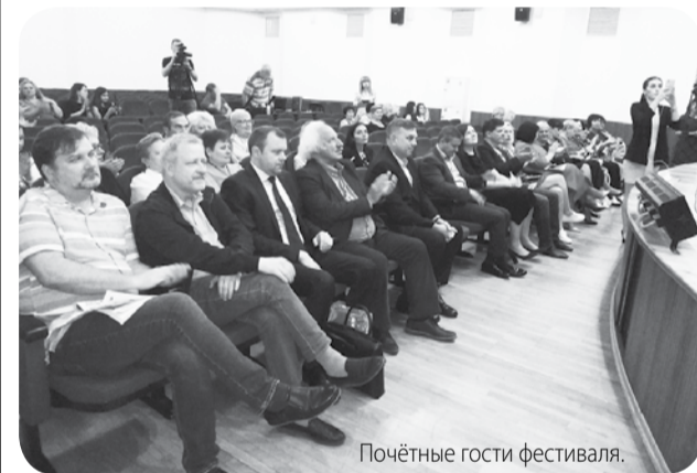
Почётные гости фестиваля.